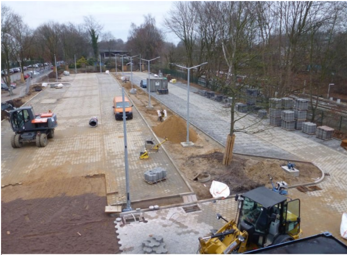
P+R Hagenbecks Tierpark