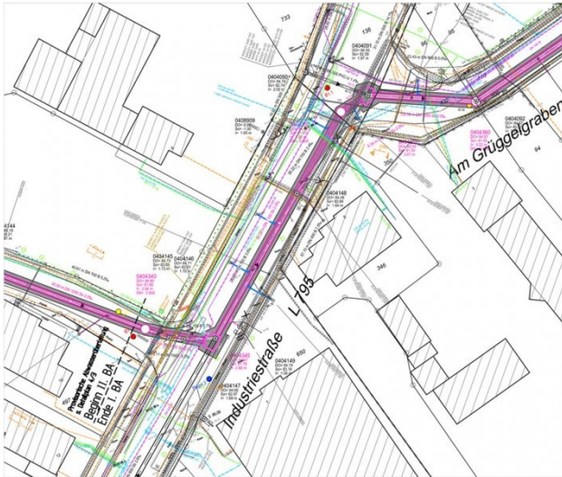
Schacht 0404355 Grundriss